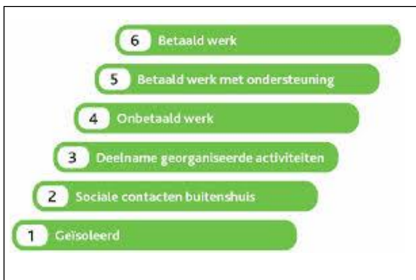
Figuur 2: De participatieladder op het domein arbeid

Een hulpmiddel bij de uitvoering van dit onderzoek kan de zogenoemde participatieladder zijn, (zie figuur 2). Deze is verwant aan het overzicht van gradaties van inclusie dat we in tabel 3 bij voorbeeld 1)